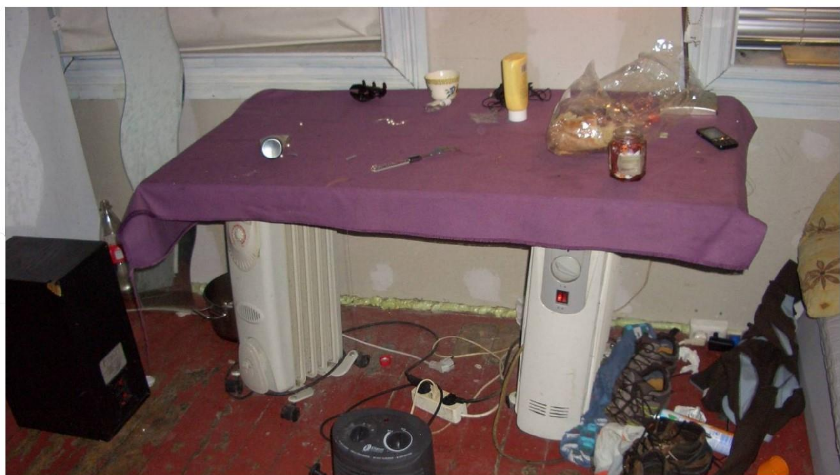
Bord plassert på to ovner som står på for fullt.