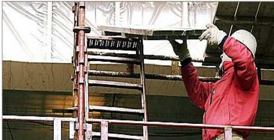
Bygg- og anleggsbransjen er på bedringens vei når det gjelder sosial dumping i følge Arbeidstilsynet.